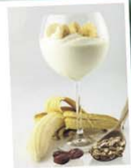
イギリスのスタッフ