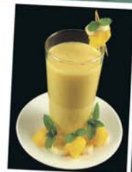
イギリスのスタッフ