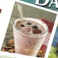
Karibische Momente Leckerer Shake für Karibik-Flair