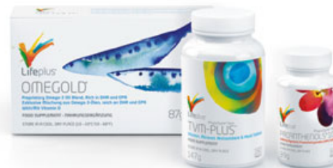
EVERYDAY WELL-BEING GOLD TVM-Plus™ Proanthensols® 100 mg OmeGold®