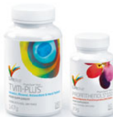
EVERYDAY WELL-BEING TVM-Plus™ Proanthensols® 100 mg