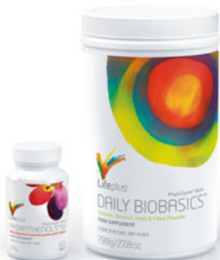
MAINTAIN & PROTECT 50 Daily BioBasics™ Proanthensols® 50 mg